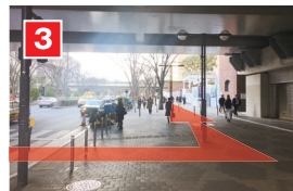
渡ったら左へ。新宿中央公園方面に進みます。