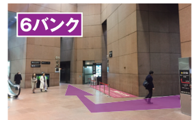
ビルに入り直進してエレベーター口へ。6バンクのエレベーターで47階へお越しください。