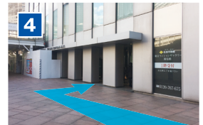
階段から50mほど進むと右側にビルの入口が見えます。