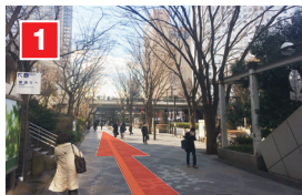
JR新宿駅西口改札から400mほど続く西口地下道(動く歩道)の終点から外へ出ると左に京王プラザホテル、右奥に新宿住友ビルが見えます。