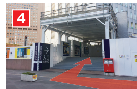
50mほど進んだ右手のビルが新宿住友ビルです。ビル周辺が工事のため防護構台の中を進み、ビル入口へ向かいます。