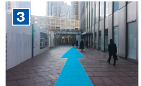
そのままビルに沿って進みます。