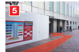
防護構台内を50mほど進むと左手にビルの入口が見えます。