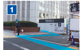
「議事堂北」交差点から都庁方面に向かうと右側に新宿住友ビルと入口を示す大きな看板が目に入ります。