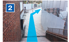
看板前に進み左側のレンガの階段を下ります。